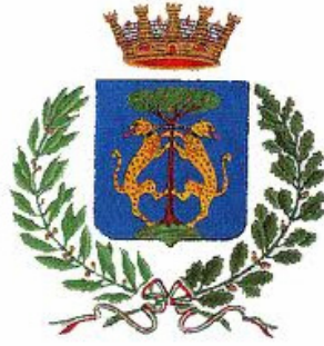
Comune di Senigallia