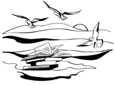
Biblioteca Comunale "Luca Orciari" Marzocca di Senigallia (AN)